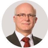
Mieczysław Augustyn Wielkopolski Bank Żywności Polski Bank Żywności