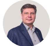
Krzysztof Baczyński Związek Pracodawców Przemysłu Opakowań i Produktów w Opakowaniach EKO-PAK